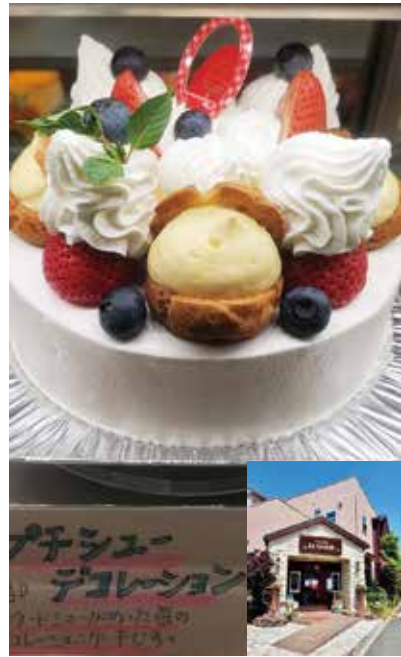
ルクプル:パチシューデコレーション

今年も沢山の方々にワークセンターが収穫したブルーベリーを食べていただきました。ありがとうございました。