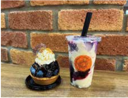
パティスリー・ローレイ